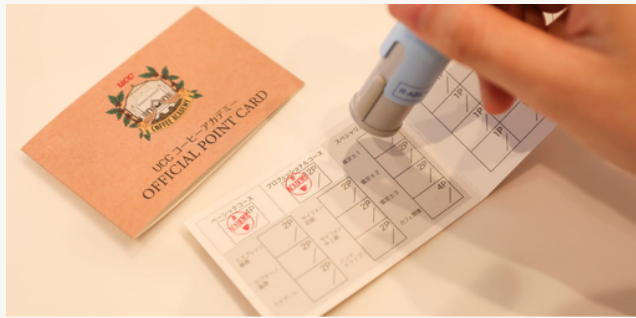
紙の旧ポイントカード（発行終了）