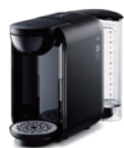
ブラック DP2 (K)