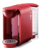
レッド DP2 (R)