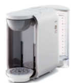
ホワイト DP2 (W)